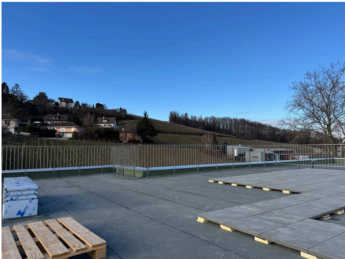
Terrasse en toiture (en cours d'aménagement)