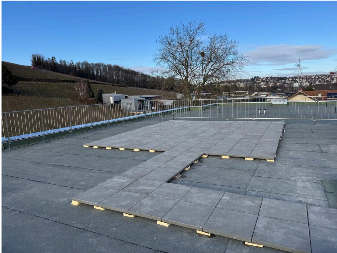
Terrasse en toiture (en cours d'aménagement)