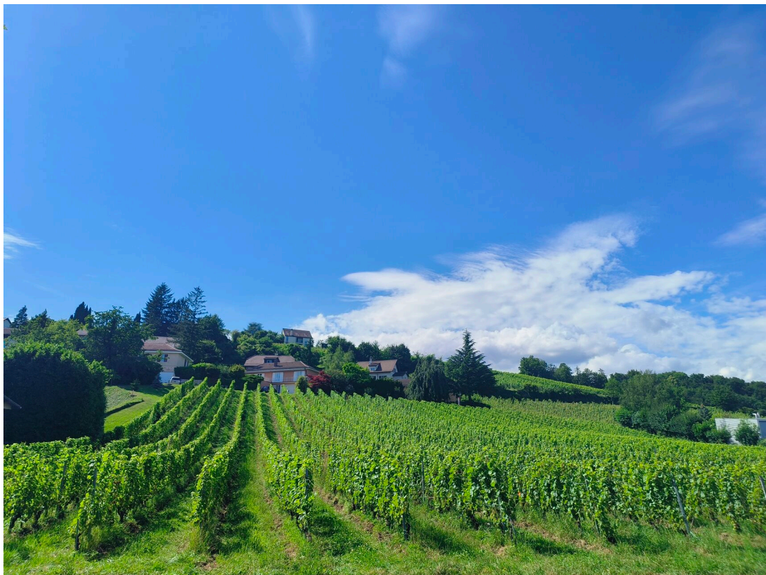
Vue sur les vignes en face de l'immeuble